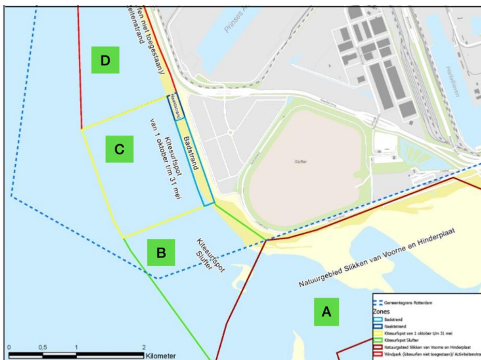
Kaart met indeling van de gebieden aan de Maasvlakte 2

De spot die bekend staat als onbetwist beste wavespot in Nederland vanwege de mega mooie en lang uitgestrekte golfslag. Dit is de plek waar een aantal windmolens in de vloedlijn of op het strand gaan komen